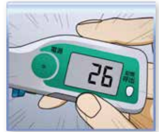
知識不足によるインスリンの過量投与