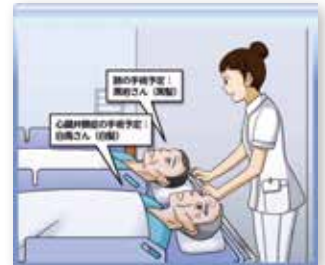
搬送時の患者取り違い