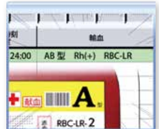
輸血用血液製剤の取り換え