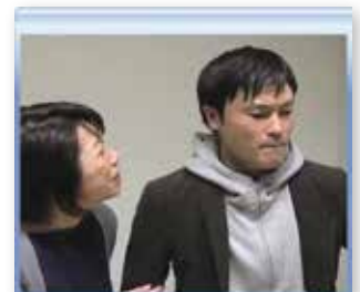
事故発生時の対応 (患者・家族への説明)